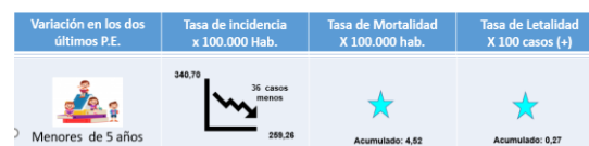
Figura 2. Comportamiento en menores de 5 años del evento COVID19 en el Distrito de Santa Marta, Periodo epidemiológico IV y V