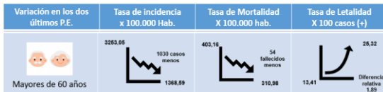
Figura 3. Comportamiento del evento COVID19 en personas mayores de 60 años en el Distrito de Santa Marta, Periodo epidemiológico IV y V